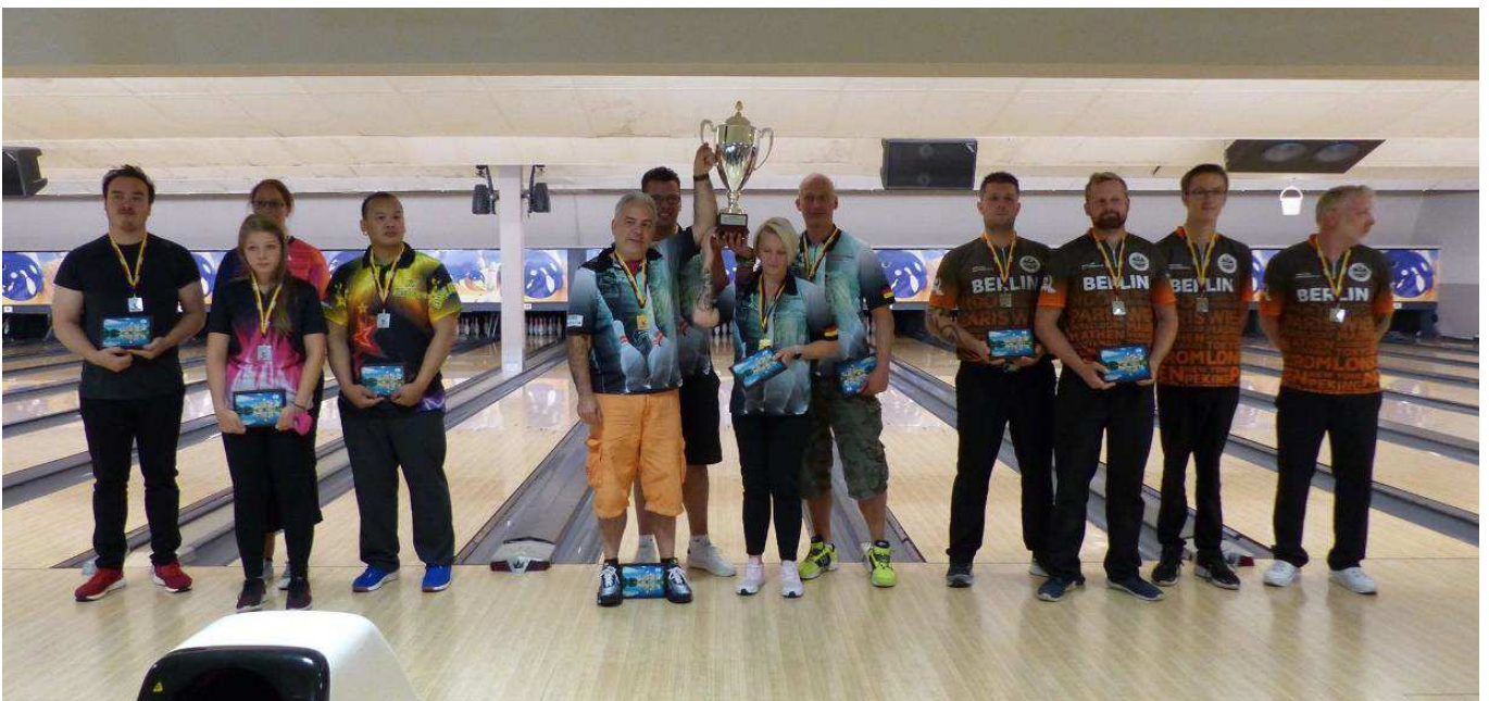
Triple X Bremerhaven (2.Platz) SG GTW Berlin (1.Platz) Team Bowling World Berlin (3.Platz)